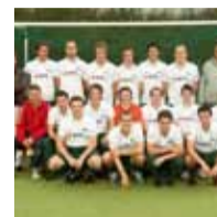
Sponsorcontract De Hopbel